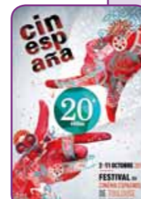
>> Festival Cinespaña au Cinéma municipal Max Linder