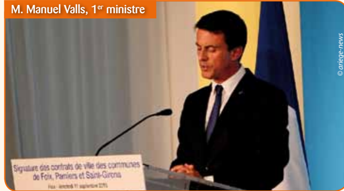
M. Manuel Valls, 1 er ministre

« Un véritable projet de société pour Saint-Girons » : c'est ainsi que François Murillo a qualifié le Contrat de Ville le 11 septembre dernier, lors de son allocution en présence du Premier ministre Manuel Valls. Rappelons que l'Etat, en 2014, a défini, dans le centre de Saint-Girons, un quartier « Cœur de ville » dit « quartier prioritaire » au regard de la politique de la ville. La délimitation a été effectuée par l'Etat en prenant en compte les ressources des populations du quartier, inférieures au seuil de pauvreté défini par l'INSEE.