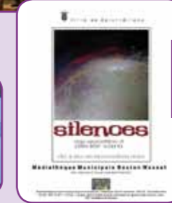
>> Exposition de peintures d'Olivier Varo à la Médiathèque municipale Gaston Massat