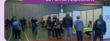
>> Rencontres Emploi Formation au Parc des Expositions