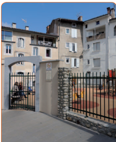
> Jardin d'enfants et mur de verdure