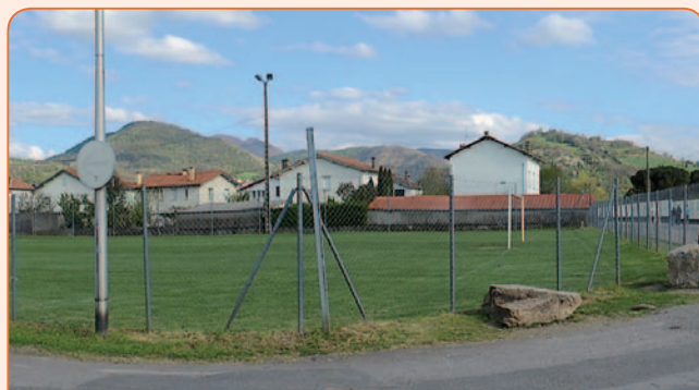
> Multi-accueil à l'honneur

Entre le lycée-collège et le centre d'incendie, les travaux du nouveau bâtiment destiné à accueillir le Centre Multi-Accueil (crèche, bureau de gestion des équipes d'assistantes maternelles etc.) ont débuté. Il viendra compléter les équipements publics déjà implantés dans ce secteur.