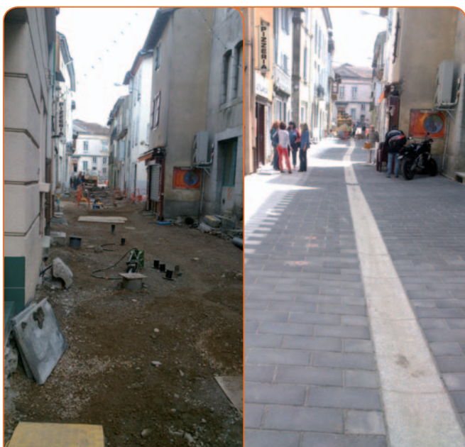
> Aménagement de la rue Joseph Pujol

Au cœur de Saint-Girons, à proximité de l'Office du Tourisme ainsi que sur la place de Verdun récemment aménagée, les enfants et les passants peuvent faire une halte dans le jardin créé à leur intention.