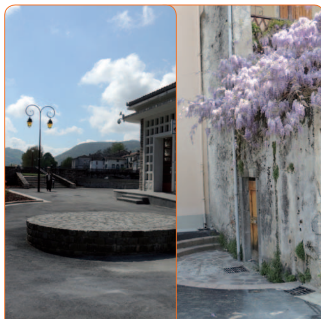
> Place Alphonse Sentein

Sur la rive gauche du Salat, la rue Joseph Pujol devient un lieu de passage prestigieux vers le Palais des Vicomtes avec des terrasses dignes des restaurants qui la bordent.