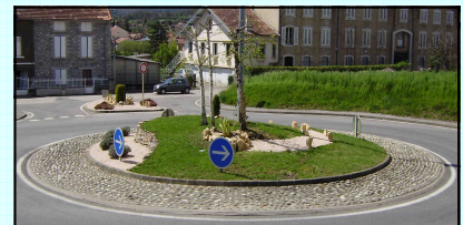
Rond-point et ilot au pied de Claire Colline