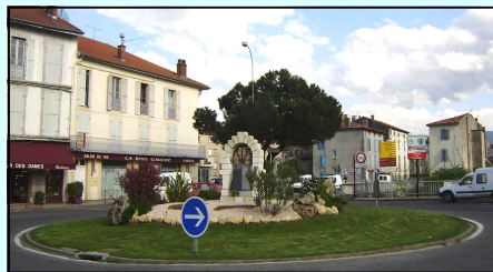
Rond-point de l'avenue Aristide Bergès

Le 16 mai 2009, l' USEP fêtera ses 70 ans à Saint-Girons. L'Union Sportive de l'Enseignement du Premier degré proposera des animations en collaboration avec des associations de l'OMSEP, et les Educateurs Territoriaux des Activités Physiques et Sportives.